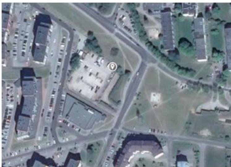
4 paveikslas. Matavimų vieta