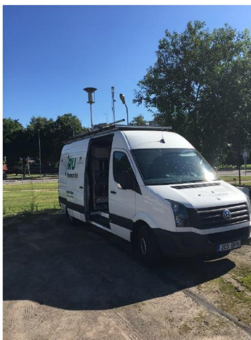
1 paveikslas. Mobilioji transporto priemonė ir tyrimo vieta

UAB „Vilniaus kogeneracinė jėgainė“ užsakė 24 valandų trukmės aplinkos oro kokybės vertinimo ir stebėjimo tyrimą Vilniaus miesto Lazdynų seniūnijos gyvenamajame rajone. Tyrimas atliktas 2017 08 07 – 2017 08 08 dienomis. Matavimai atlikti ir oro kokybė įvertinta vietoje, kurios koordinatės – 54°40'03.3"N; 25°12'56.1"E (žr. 1 ir 3 paveikslus). Matavimo rezultatai surinkti siekiant nustatyti oro teršalų koncentracijos dydį aplinkos ore bei įvertinti toliau pateiktų teršalų kiekį: vandenilio chlorido (HCl), vandenilio fluorida (HF), amoniako (NH 3 ), benzo(a)pireno (B(a)P), dioksinų (PCDDs) ir furanų (PCDFs). Taip pat tyrimo metu atlikti vietos meteorologinių parametru matavimai.