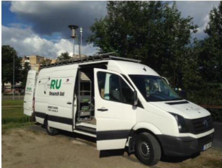
3 paveikslas. Matavimų vieta ir vienetai