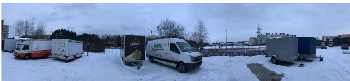
1 paveikslas. Mobilioji transporto priemonė ir tyrimo vieta

UAB „Vilniaus kogeneracinė jėgainė“ užsakė 24 valandų trukmės aplinkos oro kokybės vertinimo ir stebėjimo tyrimą Vilniaus miesto Lazdynų seniūnijos gyvenamajame rajone. Tyrimas atliktas 2018 02 12 – 2018 02 13 dienomis. Matavimai atlikti ir oro kokybė įvertinta vietoje, kurios koordinatės – 54°40'03.3"N; 25°12'56.1"E (žr. 1 ir 3 paveikslus). Matavimo rezultatai surinkti siekiant nustatyti oro teršalų koncentracijos dydį aplinkos ore bei įvertinti toliau pateiktų teršalų kiekį: vandenilio chlorido (HCl), vandenilio fluorida (HF), amoniako (NH 3 ), benzo(a)pireno (B(a)P), dioksinų (PCDDs) ir furanų (PCDFs). Taip pat tyrimo metu atlikti vietos meteorologinių parametru matavimai.