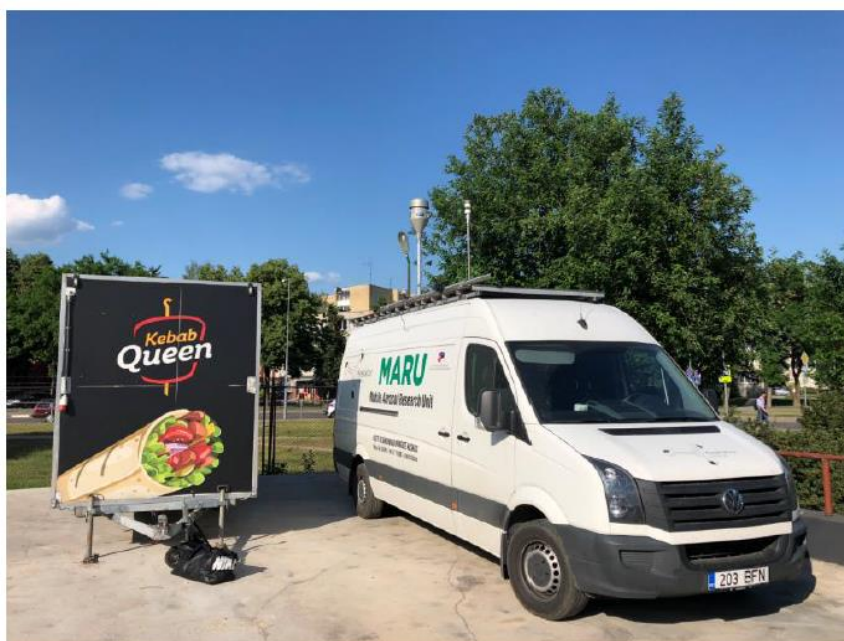
1 paveikslas. Mobilioji transporto priemonė ir tyrimo vieta

UAB „Vilniaus kogeneracinė jėgainė“ užsakė 24 valandų trukmės aplinkos oro kokybės vertinimo ir stebėjimo tyrimą Vilniaus miesto Lazdynų seniūnijos gyvenamajame rajone. Tyrimas atliktas 2018 05 29 – 2018 05 30 dienomis. Matavimai atlikti ir oro kokybė įvertinta vietoje, kurios koordinatės – 54°40'03.3"N; 25°12'56.1"E (žr. 1 ir 3 paveikslus). Matavimo rezultatai surinkti siekiant nustatyti oro teršalų koncentracijos dydį aplinkos ore bei įvertinti toliau pateiktų teršalų kiekį: vandenilio chlorido (HCl), vandenilio fluorida (HF), amoniako (NH 3 ), benzo(a)pireno (B(a)P). Taip pat tyrimo metu atlikti vietos meteorologinių parametru matavimai.