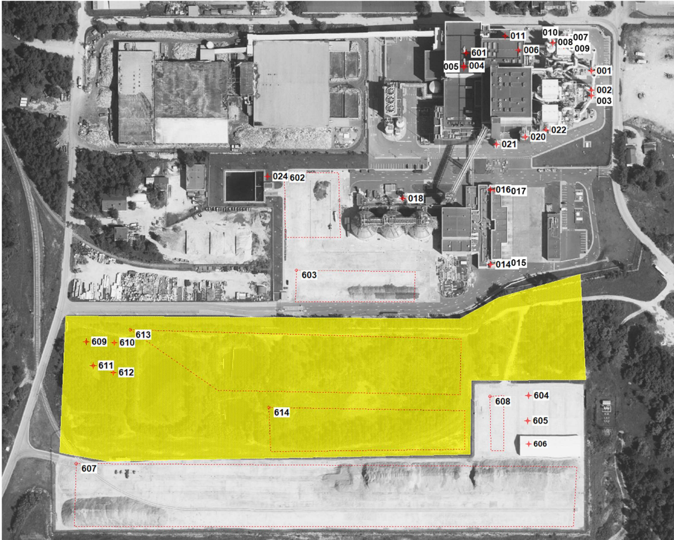
1 pav. Stacionarių oro taršos šaltinių schema