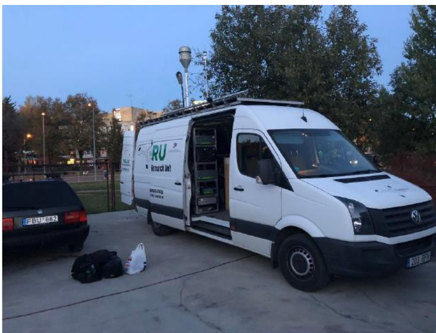
1 paveikslas. Mobilioji transporto priemonė ir tyrimo vieta

UAB „Vilniaus kogeneracinė jėgainė“ užsakė 24 valandų trukmės aplinkos oro kokybės vertinimo ir stebėjimo tyrimą Vilniaus miesto Lazdynų seniūnijos gyvenamajame rajone. Tyrimas atliktas 2018 10 09 – 2018 10 10 dienomis. Matavimai atlikti ir oro kokybė įvertinta vietoje, kurios koordinatės – 54°40'03.3"N; 25°12'56.1"E (žr. 1 ir 3 paveikslus). Matavimo rezultatai surinkti siekiant nustatyti oro teršalų koncentracijos dydį aplinkos ore bei įvertinti toliau pateiktų teršalų kiekį: vandenilio chlorido (HCl), vandenilio fluorida (HF), amoniako (NH 3 ), benzo(a)pireno (B(a)P), dioksinų (PCDDs) ir furanų (PCDFs). Taip pat tyrimo metu atlikti vietos meteorologinių parametru matavimai.