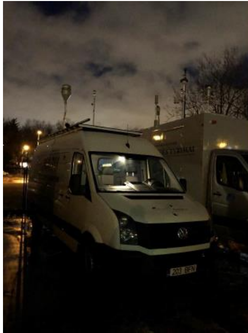
2 paveikslas. Mobilioji transporto priemonė ir tyrimo vieta