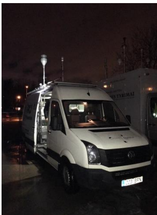
1 paveikslas. Mobilioji transporto priemonė ir tyrimo vieta

UAB „Vilniaus kogeneracinė jėgainė“ užsakė 24 valandų trukmės aplinkos oro kokybės vertinimo ir stebėjimo tyrimą Vilniaus miesto Lazdynų seniūnijos gyvenamajame rajone. Tyrimas atliktas 2019 02 20 – 2019 02 21 dienomis. Matavimai atlikti ir oro kokybė įvertinta vietoje, kurios koordinatės – 54°40'03.3"N; 25°12'56.1"E (žr. 1 ir 3 paveikslus). Matavimo rezultatai surinkti siekiant nustatyti oro teršalų koncentracijos dydį aplinkos ore bei įvertinti toliau pateiktų teršalų kiekį: vandenilio chlorido (HCl), vandenilio fluorida (HF), amoniako (NH 3 ), benzo(a)pireno (B(a)P), dioksinų (PCDDs) ir furanų (PCDFs). Taip pat tyrimo metu atlikti vietos meteorologinių parametų matavimai.