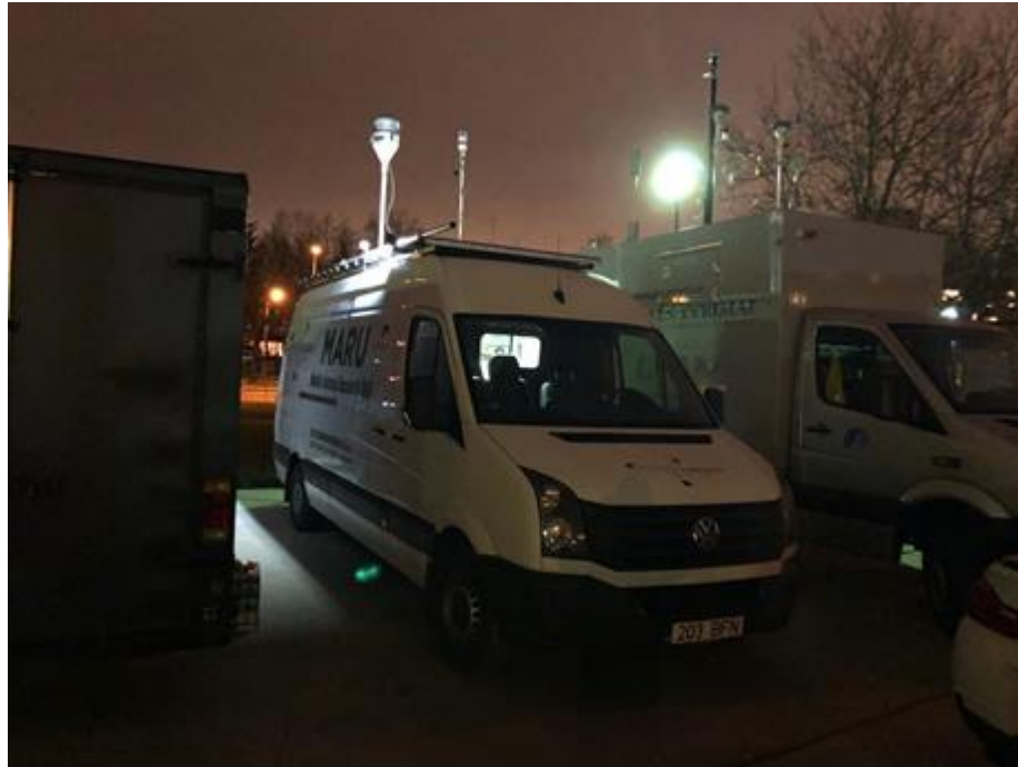
3 paveikslas. Matavimų vieta ir vienetai