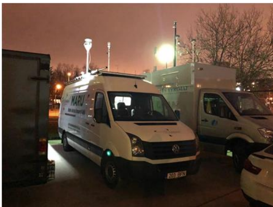
1 paveikslas. Mobilioji transporto priemonė ir tyrimo vieta

UAB „Vilniaus kogeneracinė jėgainė“ užsakė 24 valandų trukmės aplinkos oro kokybės vertinimo ir stebėjimo tyrimą Vilniaus miesto Lazdynų seniūnijos gyvenamajame rajone. Tyrimas atliktas 2018 11 21 – 2017 11 22 dienomis. Matavimai atlikti ir oro kokybė įvertinta vietoje, kurios koordinatės – 54°40'03.3"N; 25°12'56.1"E (žr. 1 ir 4 paveikslus). Matavimo rezultatai surinkti siekiant nustatyti oro teršalų koncentracijos dydį aplinkos ore bei įvertinti toliau pateiktų teršalų kiekį: vandenilio chlorido (HCl), vandenilio fluorida (HF), amoniako (NH 3 ), benzo(a)pireno (B(a)P). Taip pat tyrimo metu atlikti vietos meteorologinių parametru matavimai.